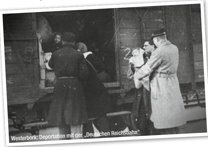
Westerbork: Deportation mit der „Deutschen Reichsbahn“

Die Züge, die vor 70 Jahren durch Deutschland fuhren, hätten gestoppt werden können, und die Kinder könnten leben – wenn Rassismus und nationalistischer Größenwahn auf entschlossenen Widerstand gestoßen wären.